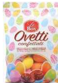
MINI VEZË LE BON 180gr