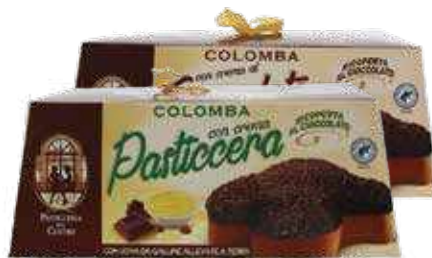
COLOMBA PASTICCERA 750gr