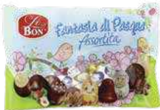
MINI VEZË FANTASIA 400gr