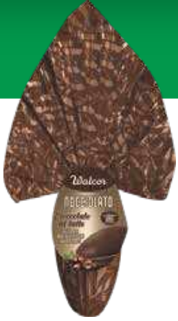
VEZË WALCOR ÇOKOLLATË ME QUMËSHIT DHE LAITHI 400gr