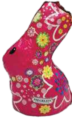
LEPUR ÇOKOLLATË 140gr