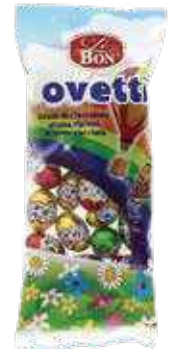
MINI VEZË LE BON 200gr