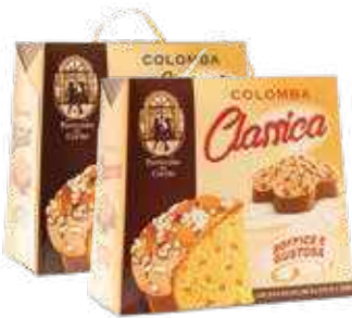
COLOMBA CLASSICA/PA SHEQERKA 900gr