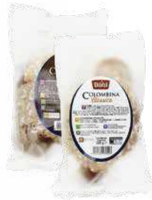
MINI KOLOMBA DONI 100gr