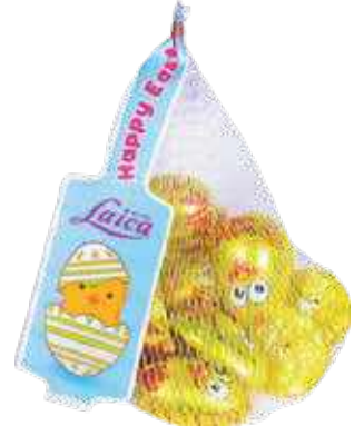
MINI ÇOKOLLATË NË RRJETË 100gr