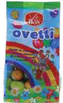
MINI VEZË LE BON 350gr