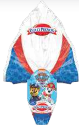
VEZË ME PERSONAZHE 40gr